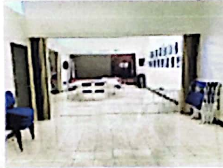
OTRA VISTA DEL SALON PRINCIPAL