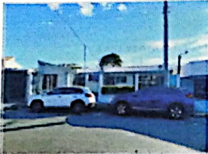
VISTA FRONTAL DE LA PROPIEDAD