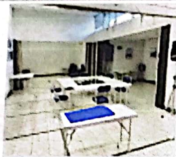
OTRA VISTA DEL SALON PRINCIPAL