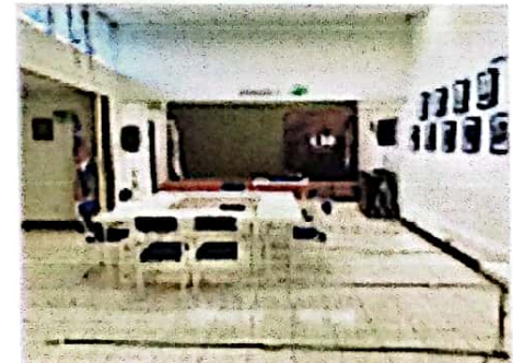
OTRA VISTA DEL SALÓN PRINCIPAL