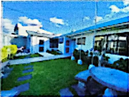
JARDIN FRONTAL Y FACHADA