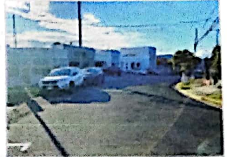
ENTORNO - VISTA HACIA EL OESTE