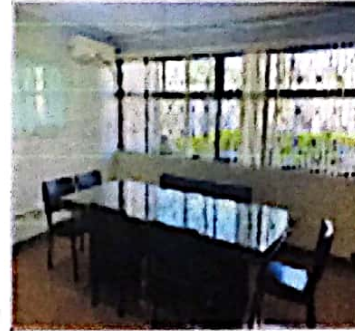
SALA DE JUNTAS