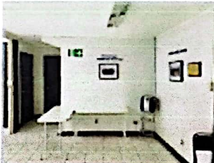
OTRA PARTE DEL SALÓN PRINCIPAL