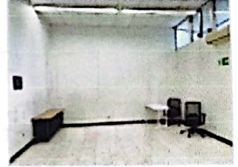
OTRA VISTA DEL SALON PRINCIPAL