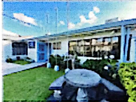
JARDIN FRONTAL Y FACHADA