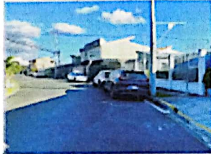
ENTORNO - VISTA HACIA EL ESTE