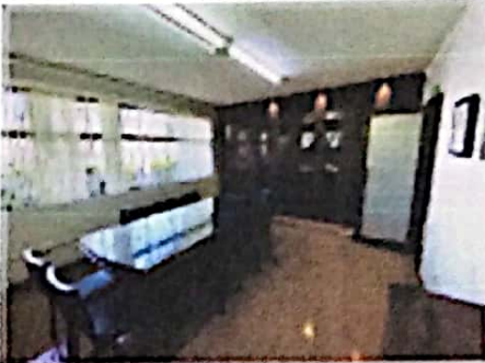
SALA DE JUNTAS